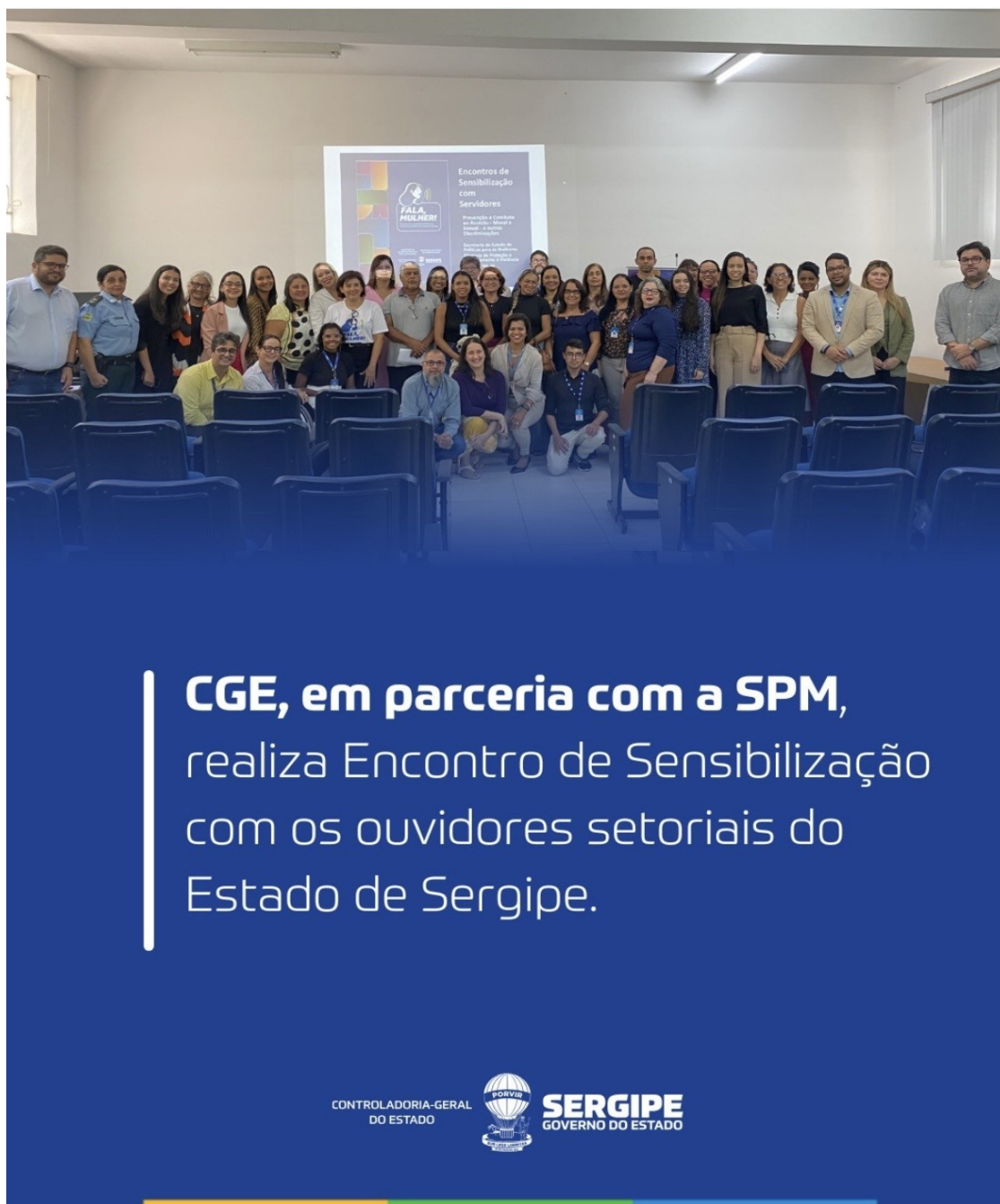
Foto 5. Encontro de Sensibilização