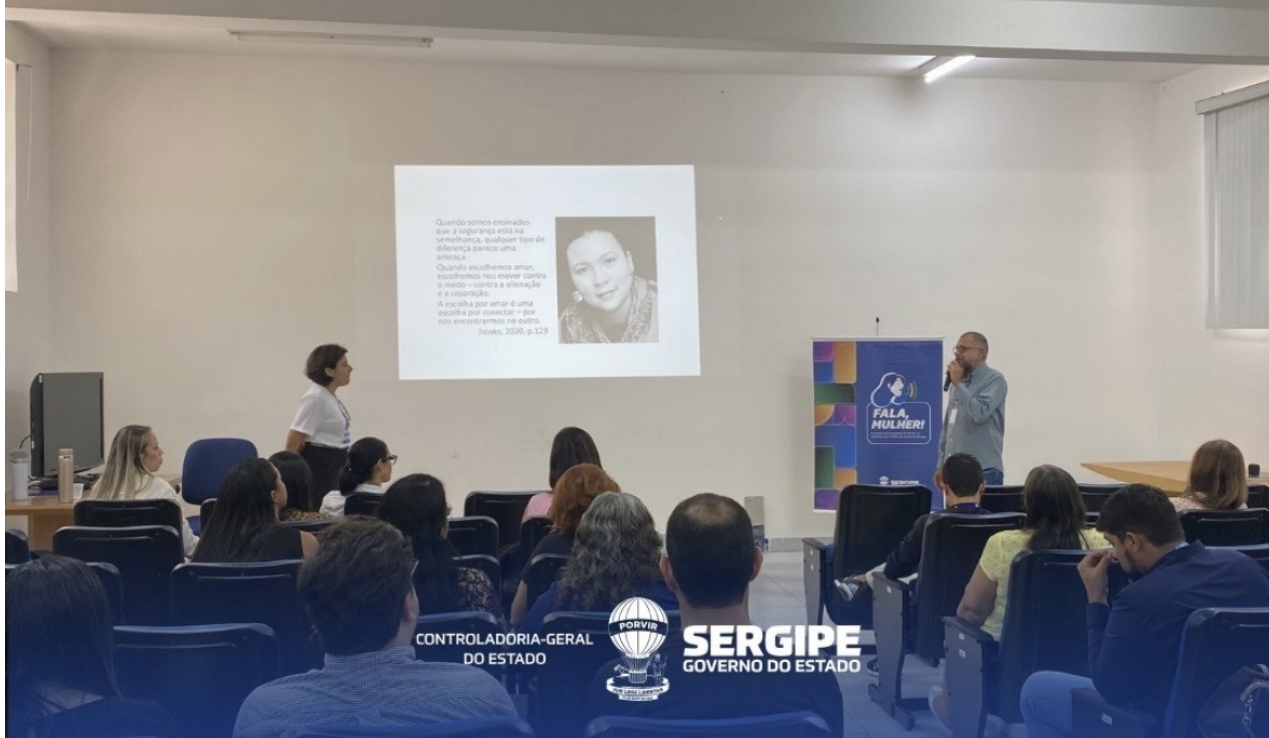
Foto 6. Auditório CGE