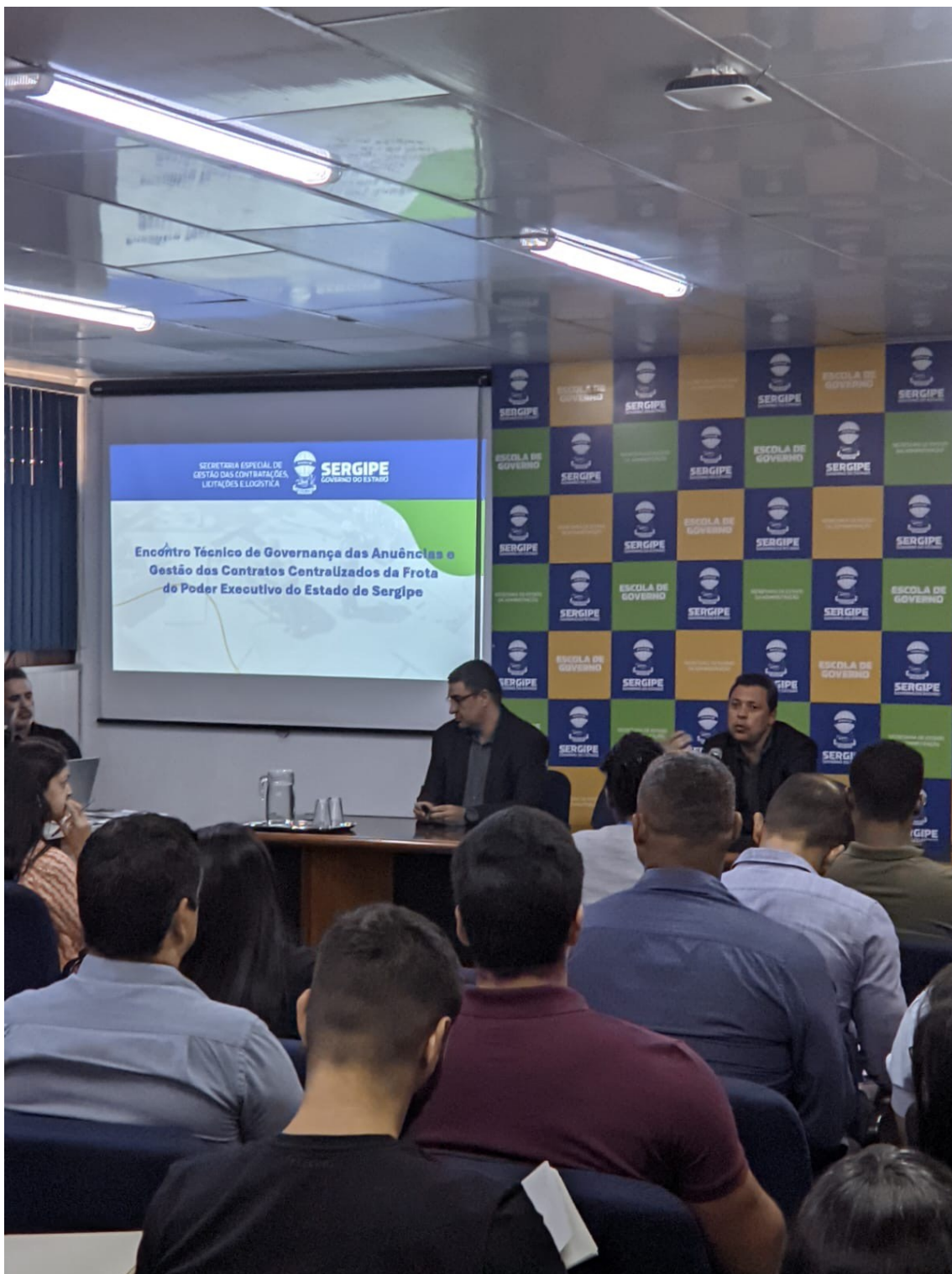
Foto 4. Painel da reunião